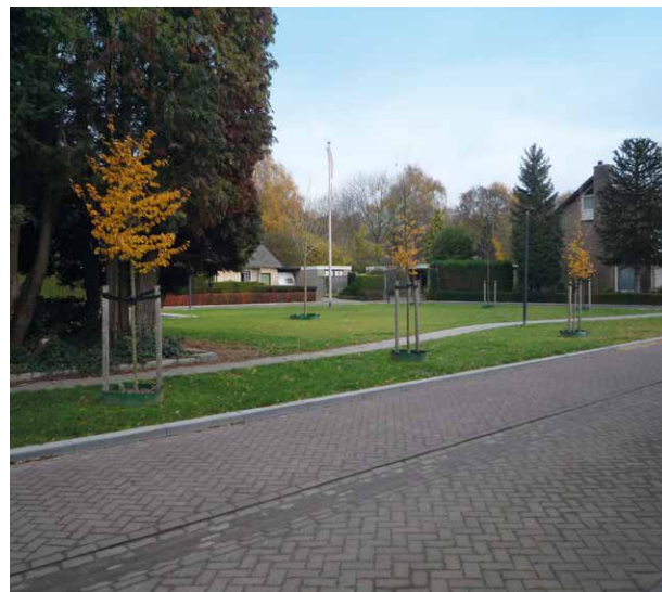
Een voorbeeld van nieuwe bomenaanplant aan De Bleker in 't Look Noord

't Look heeft een prettige, groene uitstraling. Maar er zijn onder én boven de grond problemen, veroorzaakt door de bomen in de wijk. Er staan bijvoorbeeld veel bomen boven kabels en leidingen of te dicht bij woningen.