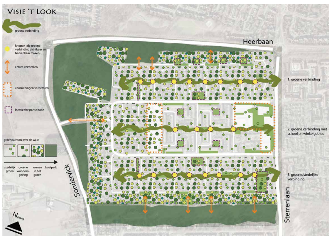
De visie op de herinrichting van 't Look in beeld gebracht.

Op basis van het definitieve ontwerp gaan wij daarna aan de slag met het uitwerken van de plannen. Denk dan aan het maken van technische tekeningen en een goed verlichtingsplan. Via een aanbestedingstraject gaan we een aannemer zoeken die de werkzaamheden gaat uitvoeren. En we maken een concept beplantingsplan. Dit laatste gebeurt naar verwachting medio 2019. Via samspraakbijeenkomsten krijgt u dan gelegenheid om te reageren op de voorgestelde keuzes van bomen en beplanting.