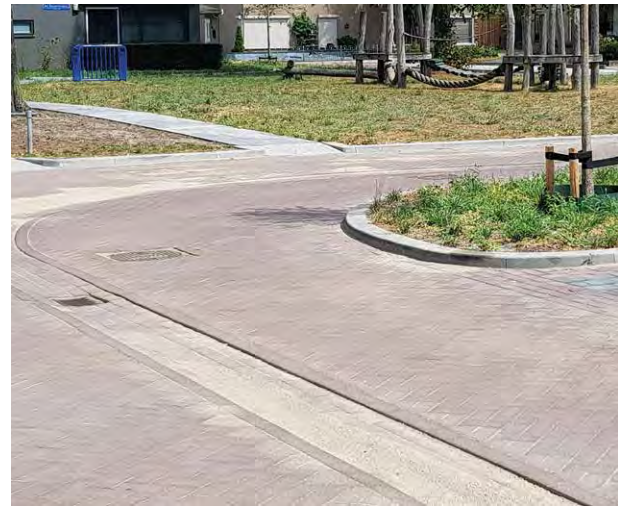
Een voorbeeld van de nieuwe weginrichting aan De Veender

Verder leggen we een apart riolsysteem aan, voor duurzame afwatering van het 'hemelwater'. Daarom krijgen de straten een goot in het midden.